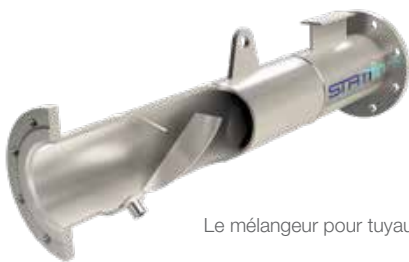
Le mélangeur pour tuyaux anti-amas