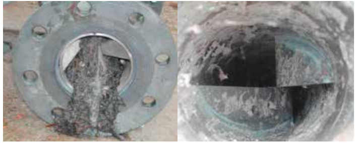
Obstruction type d'un mélangeur concurrent après moins de 5 heures